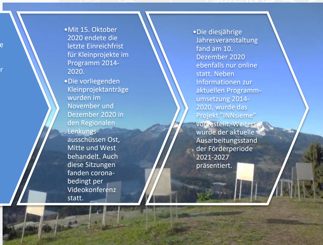
Erlebnisort Georunde Sibratsgfall

• Die diesjährige Jahresveranstaltung fand am 10. Dezember 2020 ebenfalls nur online statt. Neben Informationen zur aktuellen Programmumsetzung 2014-2020, wurde das Projekt "INNSieme" vorgestellt. Weiters wurde der aktuelle Ausarbeitungsstand der Förderperiode 2021-2027 präsentiert.